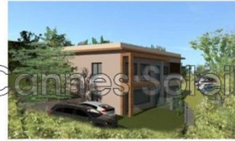
Vue de l'angle Nord