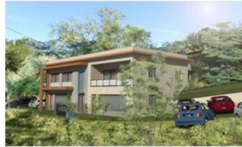
Vue de l'angle Ouest