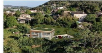
Vue de la façade Nord - Ouest