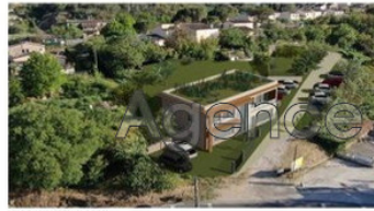
Vue de l'angle Nord